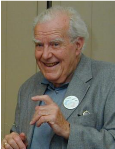
Jahrgang 1920, † 2010