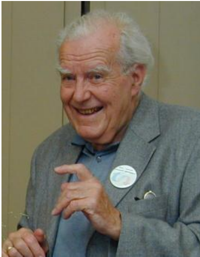
Jahrgang 1920, † 2010